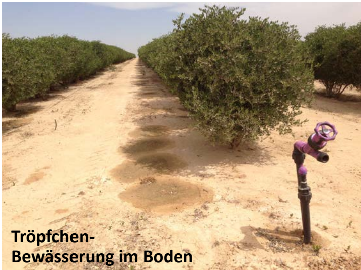
Tröpfchen- Bewässerung im Boden

Vortragsbestellung : Ari Lipinski lipinski@israel-laad-freunde.de , 0172-7161894 , www.arilipinski.com