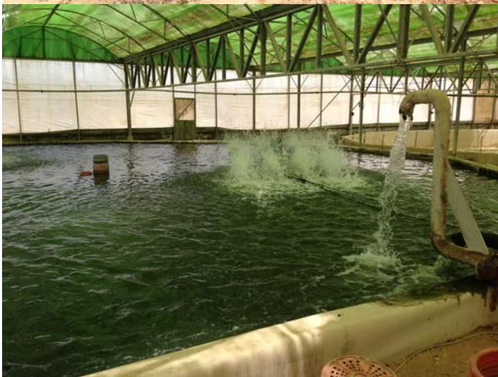
ISRAEL LAAD-Studenten im Negev erfahren über Fischzucht in der Wüste im Umweltstudium.