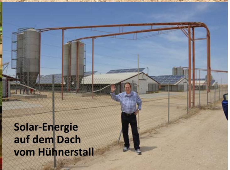
Solar-Energie auf dem Dach vom Hühnerstall