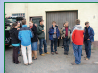
Ausflug der ehemaligen Israel-Mitarbeiter